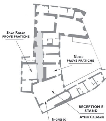
DISPOSIZIONE DELLE SALE DELLA ROCCA